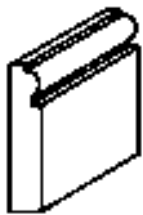
踢腳板上的 半圓線腳