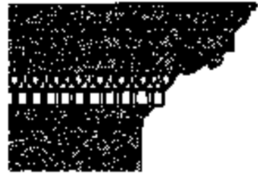
上有卵鉤飾壁帶， 下有齒狀壁帶的飛簷

卵鉤飾 (egg-and-dart pattern) 圖案，常見於雕刻建築壁帶，包括綴有箭矢圖案的一排卵形。