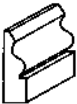
有雙彎線的鑄物橫截面