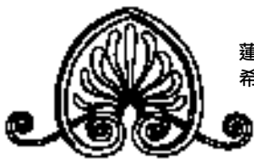
蓮葉中的希臘花飾

仿古 (antiquing) 利用粉刷步驟造假被粉刷物的年齡，模仿因塵埃污垢造成的褪色。